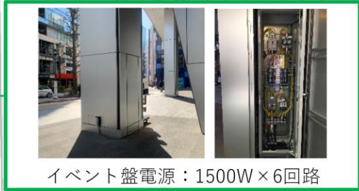
イベント盤電源：1500W×6回路

最大高さ4m 但し、「Theater & Restaurants」のサイン及び、ショップ、ショーウィンドウの見通しが確保できるレイアウトにてご調整ください。